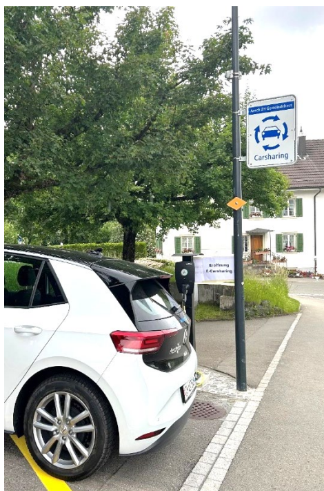
Standort hinter dem Gemeindehaus eingangs Feldstrasse

Über die Handy-App: Starten der Buchung, Öffnen / Verriegeln des Fahrzeugs, Beenden der Buchung