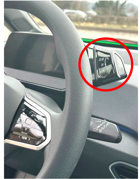
Fahren mit Rekuperation (Rückgewinnung von Strom bei Verlangsamung): Schalthebel auf Fahrmodus «B» stellen