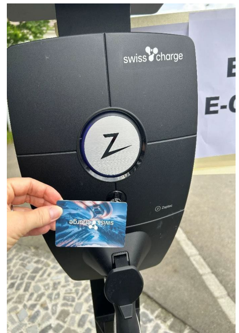
Laden nach der Nutzung: Ladekabel einstecken, Karte an Ladestation halten, auf Klick und blaues Licht warten